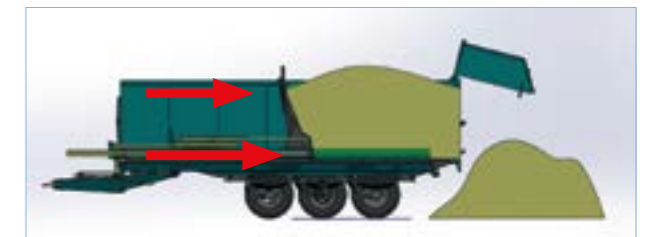
A plató feléig a homlokfal és a padozat együtt mozog