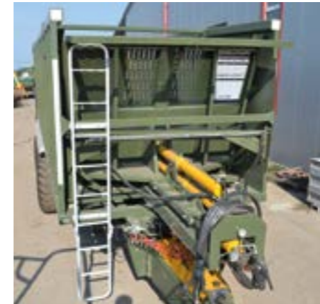
Tolófal és tolóberendezés