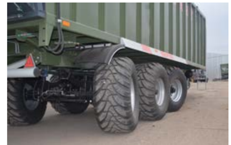
Önbeálló mellső és hátsó tengely