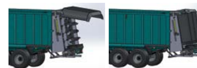
Opcionális hátfal mészsizap és csirketrágya szóráshoz 24 m munkaszélességgel