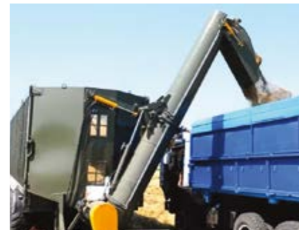
Hidraulikusan dönthető átrakócsiga