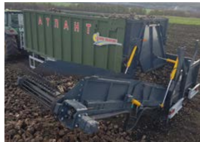
Hidraulikus ráfolyás szabályzás