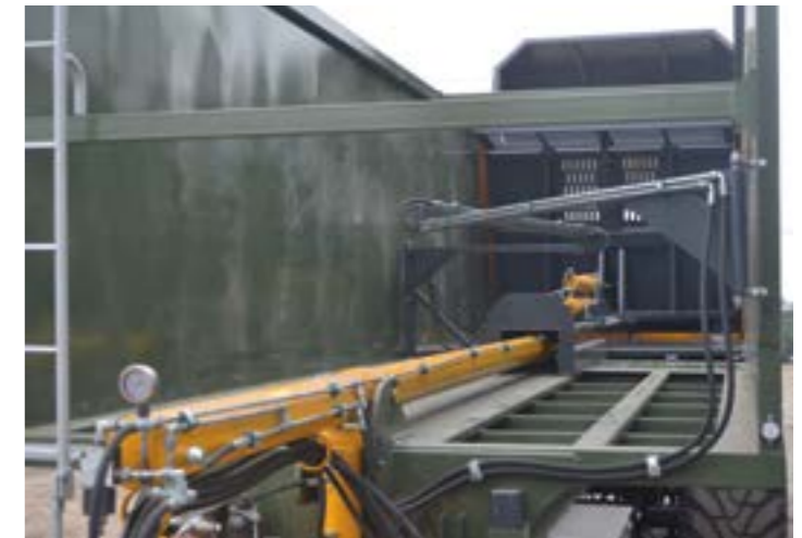
A tolófal hidraulika rendszere