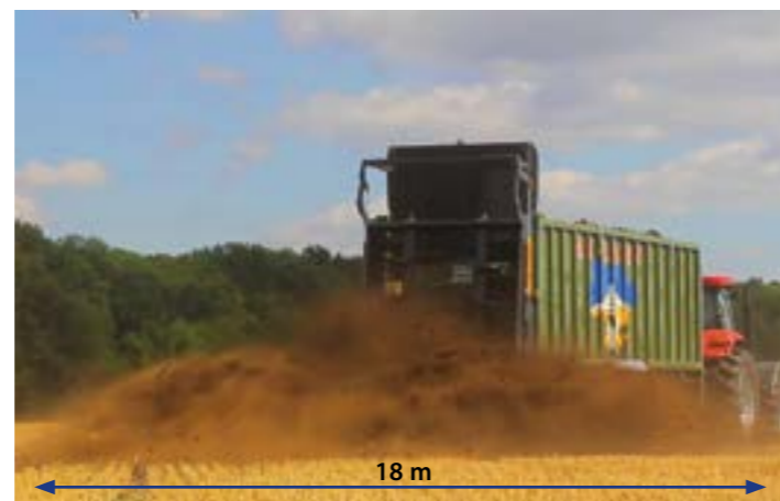
Munkaszélesség 18 m